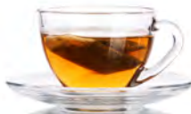
1 Tasse Tee