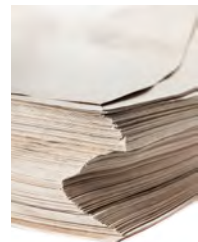
1 Kilogramm Recyclingpapier