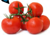
1 Kilogramm Tomaten