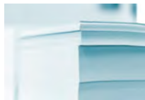
1 Kilogramm Normales Papier